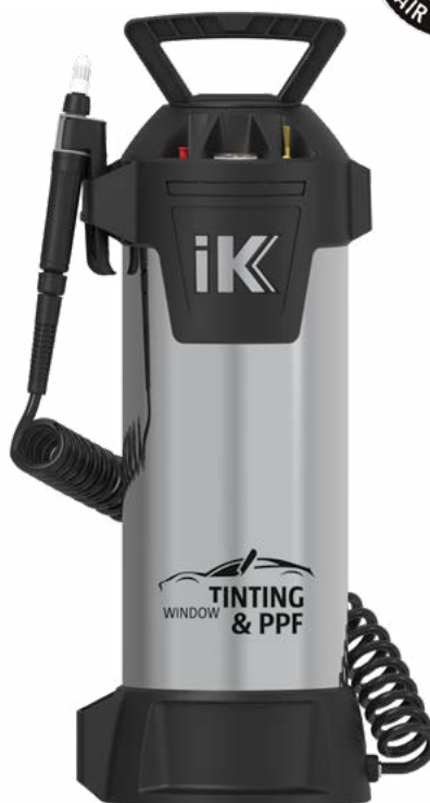
IK TINTING & PPF